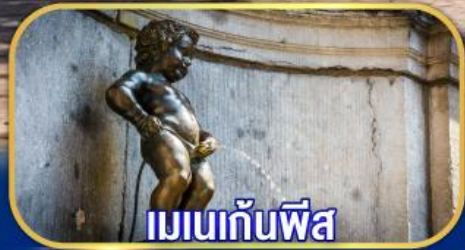
เมนกันพีส