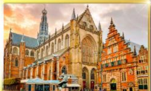
จัตุรัสเมืองฮาร์ลิม

ชมแคนเมืองแปลกเนเธอร์แลนด์และเบลเยียม เดินเมืองเคลฟท์ เมืองเครื่องปั้นดินเผาระดับโลก ฮาร์ลิมเมืองมั่งคั่งที่สุดของเนเธอร์แลนด์