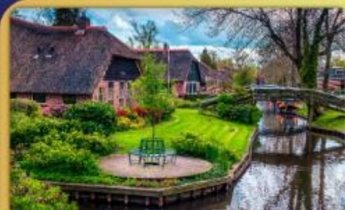
ล่องเรือหมู่บ้านไรทอนท์ธูร์น