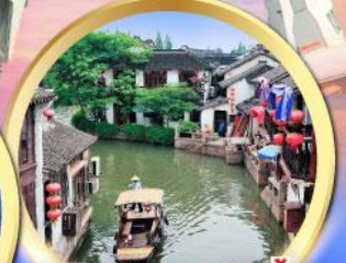
หมู่บ้านโบราณจูเจียเจี้ยว ล่องเรือแจว