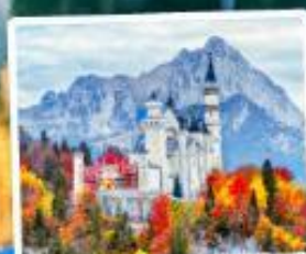
ปราสาทน้อยชวานส์ไตน์