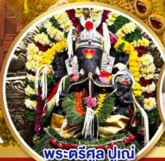
พระตรีศูล ปูणे (Trishul Pune)