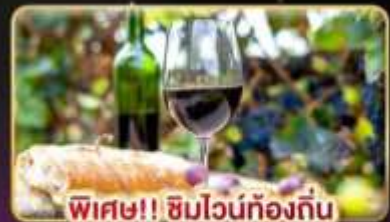
พิเศษ!! ซิมวอน์ท้องถิ่น