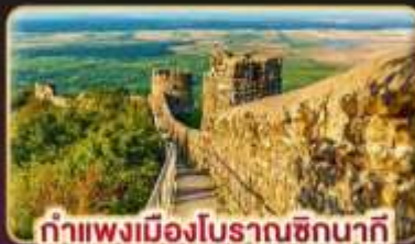
กำแพงเมืองโบราณชิกนากี