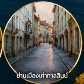
ย่านเมืองเก่าทาลลินน์