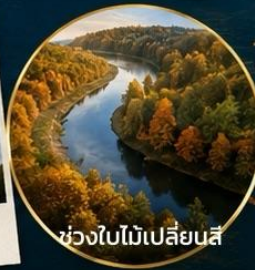
ช่วงใบไม้เปลี่ยนสี