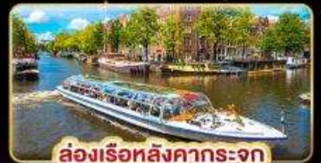
ล่องเรือหลังคากระจุก