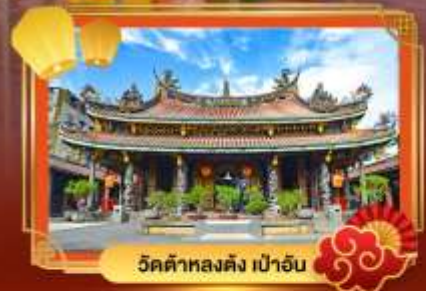
วัดต้าหลงตง เป่าอั้น